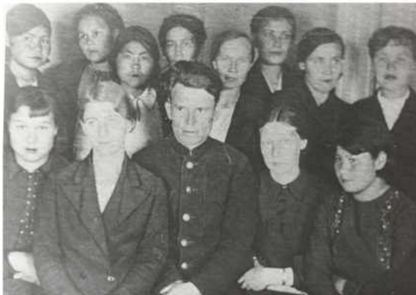
с. Палана, курсы медсестер, 9.07.1944 г.

Ранним утром в воскресенье, 22 июня 1941 года, нацистская Германия и ее союзники обрушили на советскую страну военный удар невиданной силы.